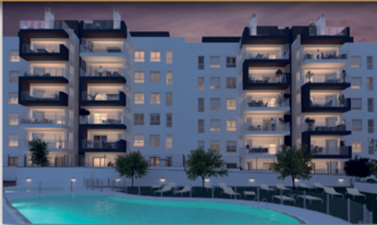
*Precio sujeto a disponibilidad. Impuestos no incluidos. Un garaje y un trastero incluidos en el precio. Imagen y calificación energética orientativa.