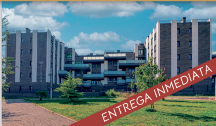
*Precio más IVA.