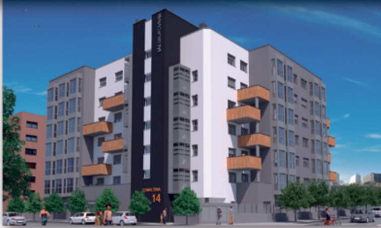
*Precio sujeto a disponibilidad. Impuestos no incluidos. Dos garajes y un trastero incluidos en el precio. Imagen y calificación energética orientativa.